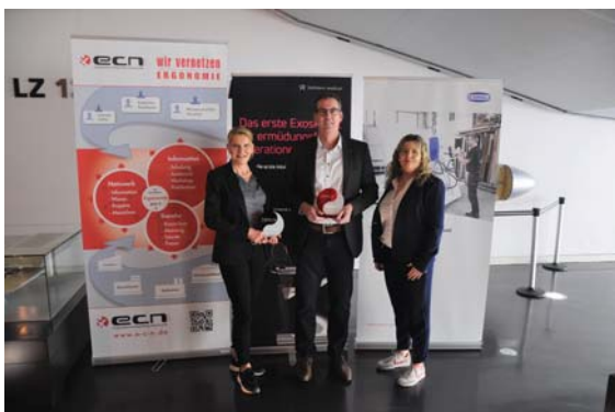
Träger der Ergonomiepreise 2023: Hellstern medical GmbH (links und rechts) und J. Schmalz GmbH (Mitte)

Fester Bestandteil der Tage der Ergonomie ist die Verleihung der ECN-Ergonomie-Preise in den Kategorien „Handgeführte Produkte“ und „Innovative Ergonomie“. Die Verleihung der Ergonomie-Preise findet als Teil der festlichen Abendveranstaltung der Tage der Ergonomie im Zeppelin Museum in Friedrichshafen am Bodensee statt.