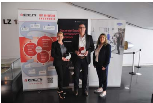
Träger der Ergonomiepreise 2023: Hellstern medical GmbH (links und rechts) und J. Schmalz GmbH (Mitte)

Der ECN e.V. möchte den Austausch von Ergonomie-Know-how unter seinen Mitgliedern fördern, steht aber auch Nichtmitgliedern mit Rat und Tat zur Seite.